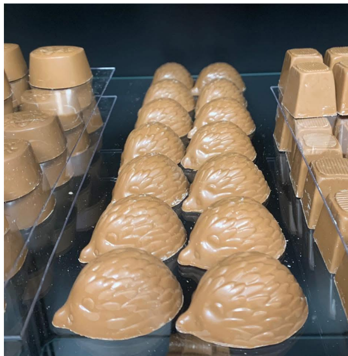
De Bolbon Rozenburg